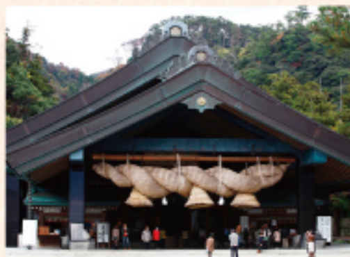
出雲大社 (車で約 80分)