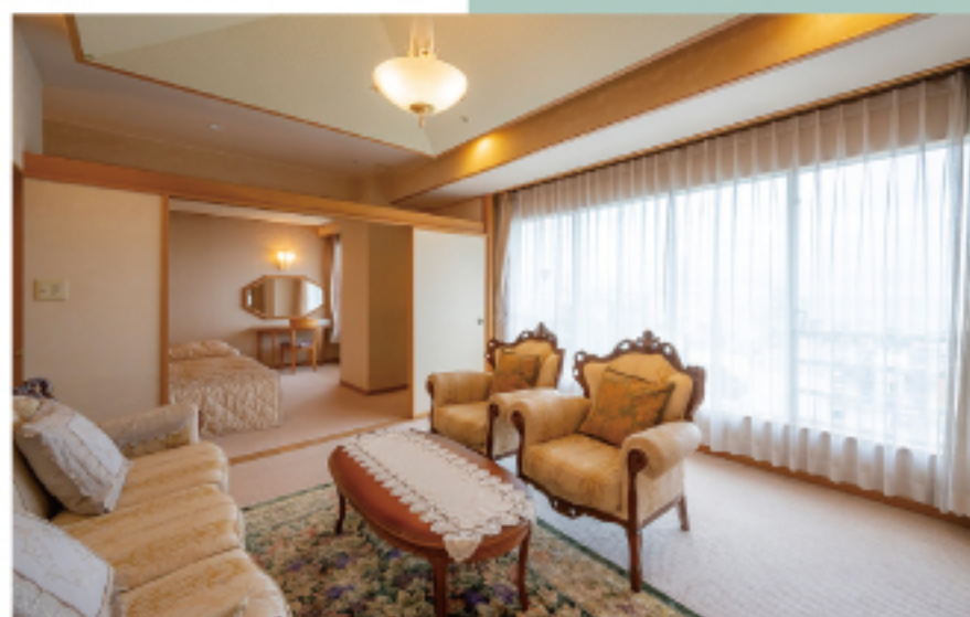
露天風呂付貴賓室 [瑞鶴]