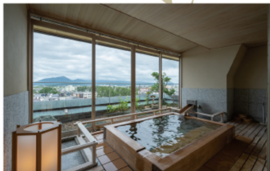
露天風呂付貴賓室 [松鶴]