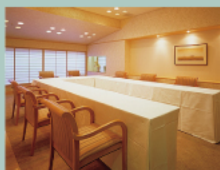
パーティールーム [萌]