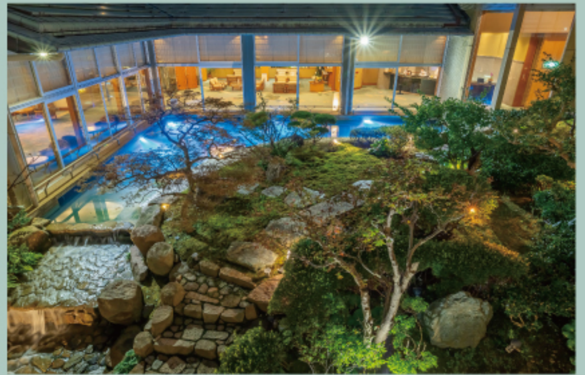
中庭「つくよみの庭」 Courtyard "TSUKUYOMI Garden"