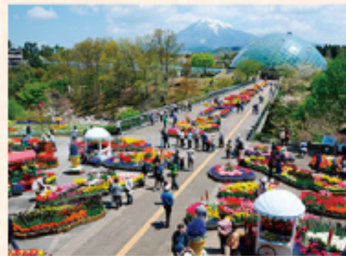
とっとり花回廊 (車で約 30分)