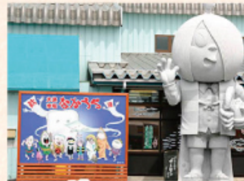
水木しげるロード (車で約 30分)