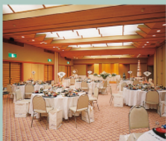
舞鶴〈パーティ形式〉