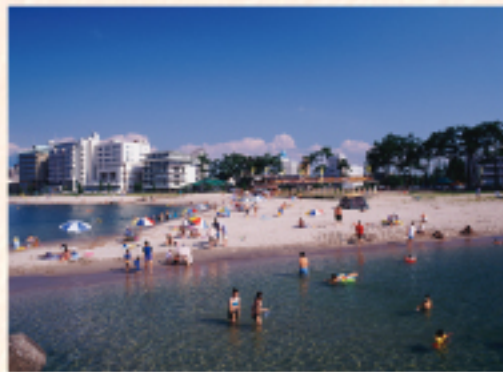
皆生海水浴場 (徒歩 3分)