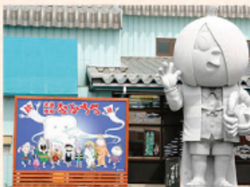
水木しげるロード (車で約 30分)