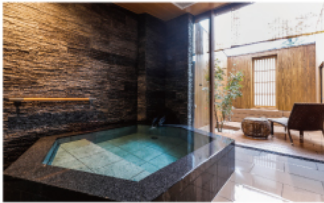
貸切風呂 [ 更紗の湯 ]