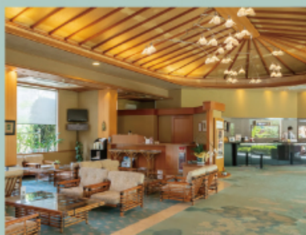
フロント Front Lobby

The winter that surrounds the warmth, the powder snow is dancing Light and happy spring Talk with flowers Playing with water in the summer to cool off Autumn thinking about the wind Color the hearts of travelers Sarasa no Yado