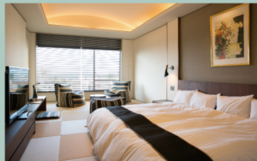
コンフォートルーム [遊鶴]