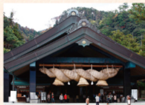
出雲大社 (車で約 80分)