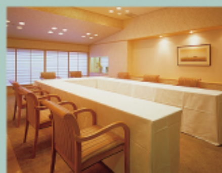
パーティールーム [萌]