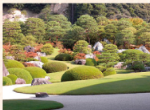
足立美術館 (車で約 30分)