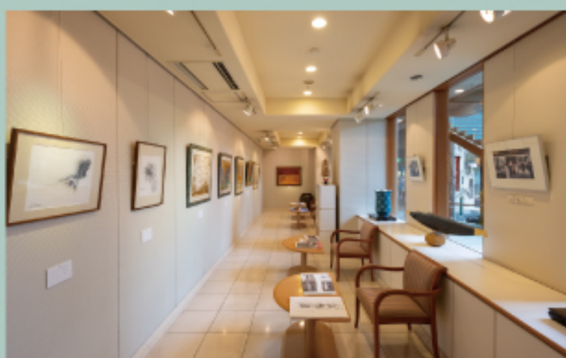
ギャラリー“蒼” Gallery “SOU”