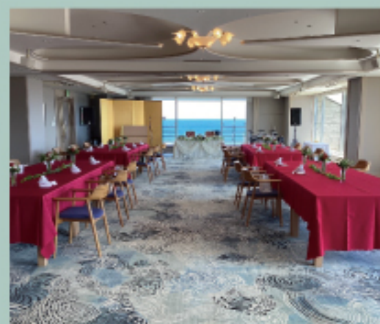
バンケットホール [大山]