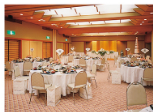
舞鶴 〈パーティ形式〉