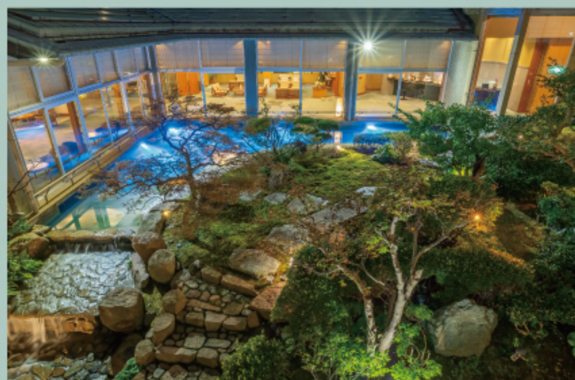
中庭 “つくよみの庭” Courtyard “TSUKUYOMI Garden”

The winter that surrounds the warmth, the powder snow is dancing Light and happy spring Talk with flowers Playing with water in the summer to cool off Autumn thinking about the wind Color the hearts of travelers Sarasa no Yado