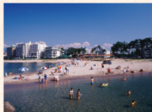
皆生海水浴場 (徒歩 3分)