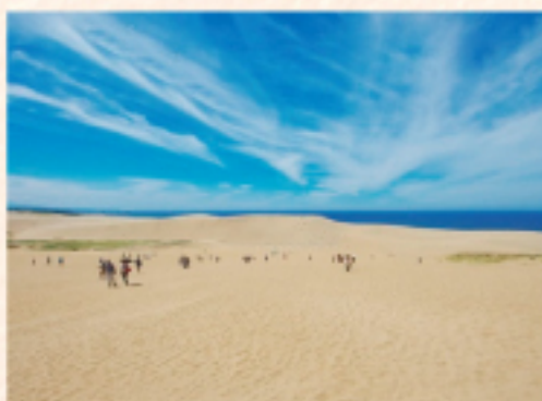
鳥取砂丘 (車で約 90分)