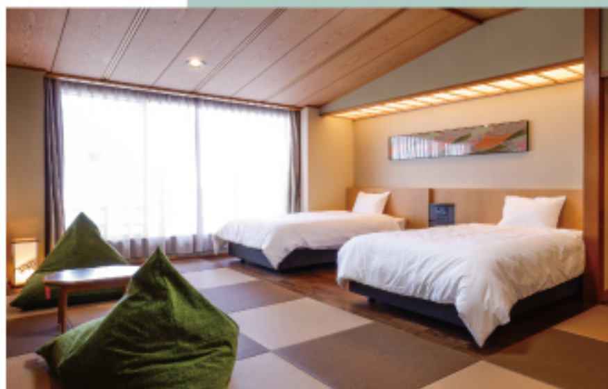
コンフォートルーム [夢鶴]