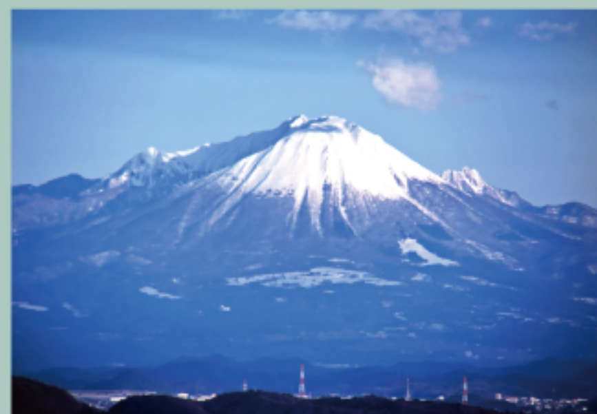
The four seasons of Mt.Daisen