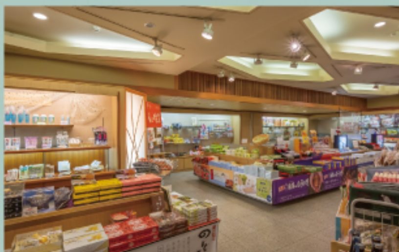
売店“おんがえし” Store “ONGAESHI”