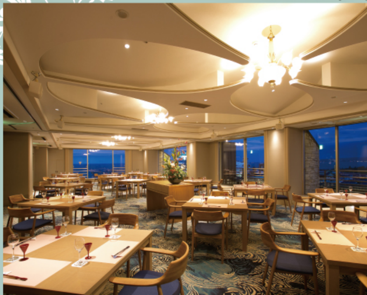
バンケットホール [大山]