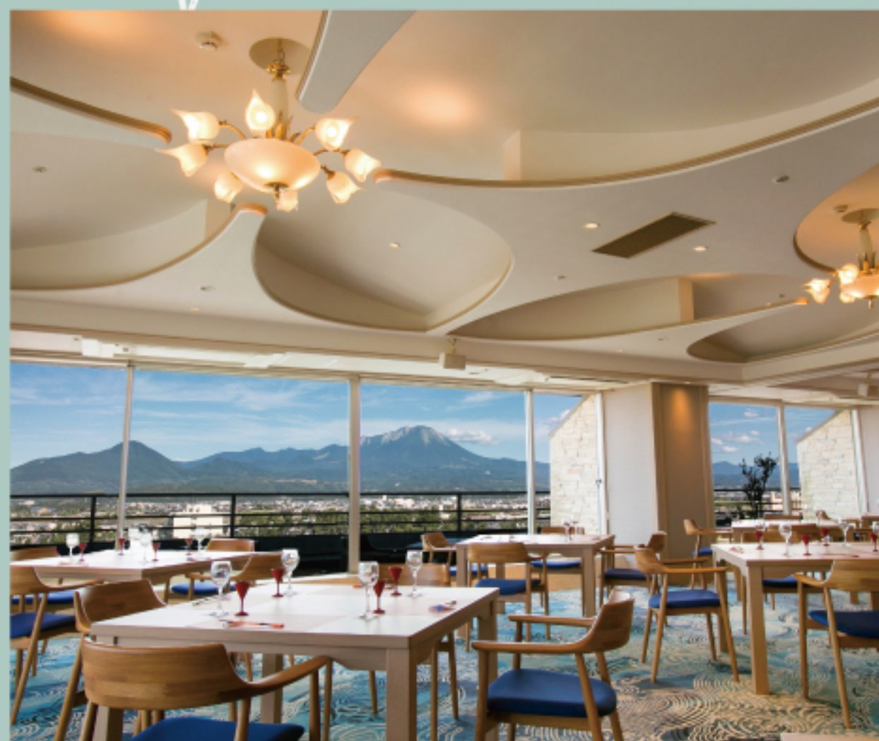
バンケットホール大山 Banquet hall “DAISEN”