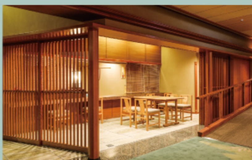
湯上り処“酔待草” After bath area “YOIMACHIGUSA”