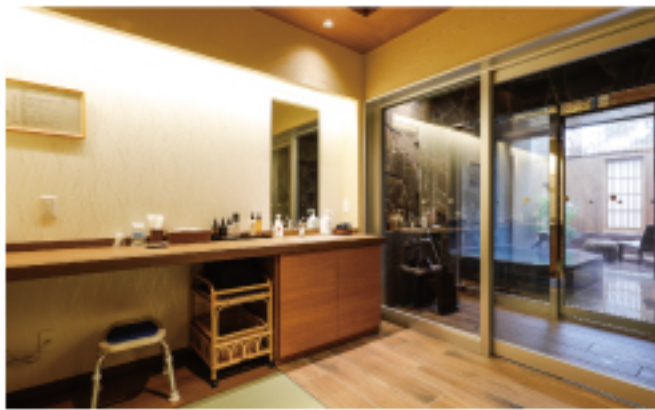
貸切風呂 [ 和みの湯 ]