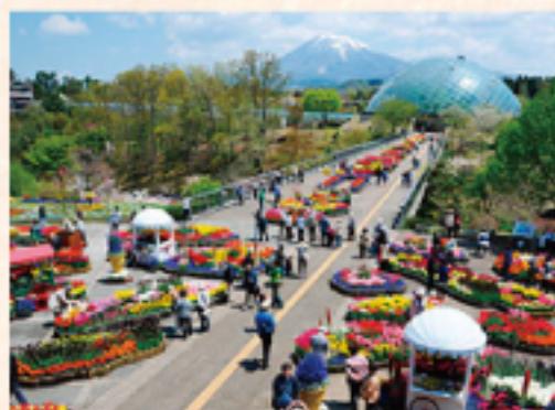
とっとり花回廊 (車で約 30分)