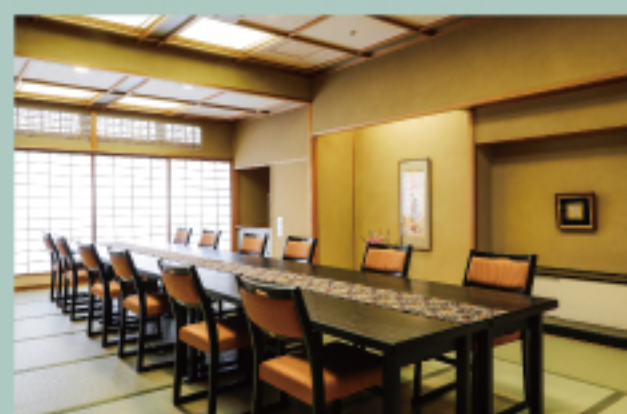
料亭個室 Japanese private restaurant